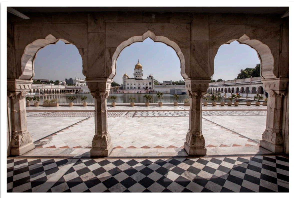
Gurudwara Bangla Sahib

Denna spännande resa till Indien har mycket av allt som är värt att se och uppleva i detta magiska land. Efter några dagar i Indiens huvudstad, Delhi, ser vi mytomspunna Taj Mahal med egna ögon, upplev Hinduernas heliga stad, Varanasi och bli hänförd av Kolkatas kaos och folkliv.