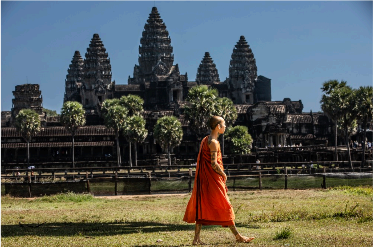
MUNK VID HUVUDTEMPLET ANGKOR WAT

Under denna resa besöker vi både Kambodja och Vietnam. Ett par intensiva dagar i området runt Angkor Wat och Siem Reap, stadsrundtur i Phnom Penh och ett par fantastiska dagar i Ho Chi Minh staden avslutar äventyret. Kommer bli en minnesvärd resa.