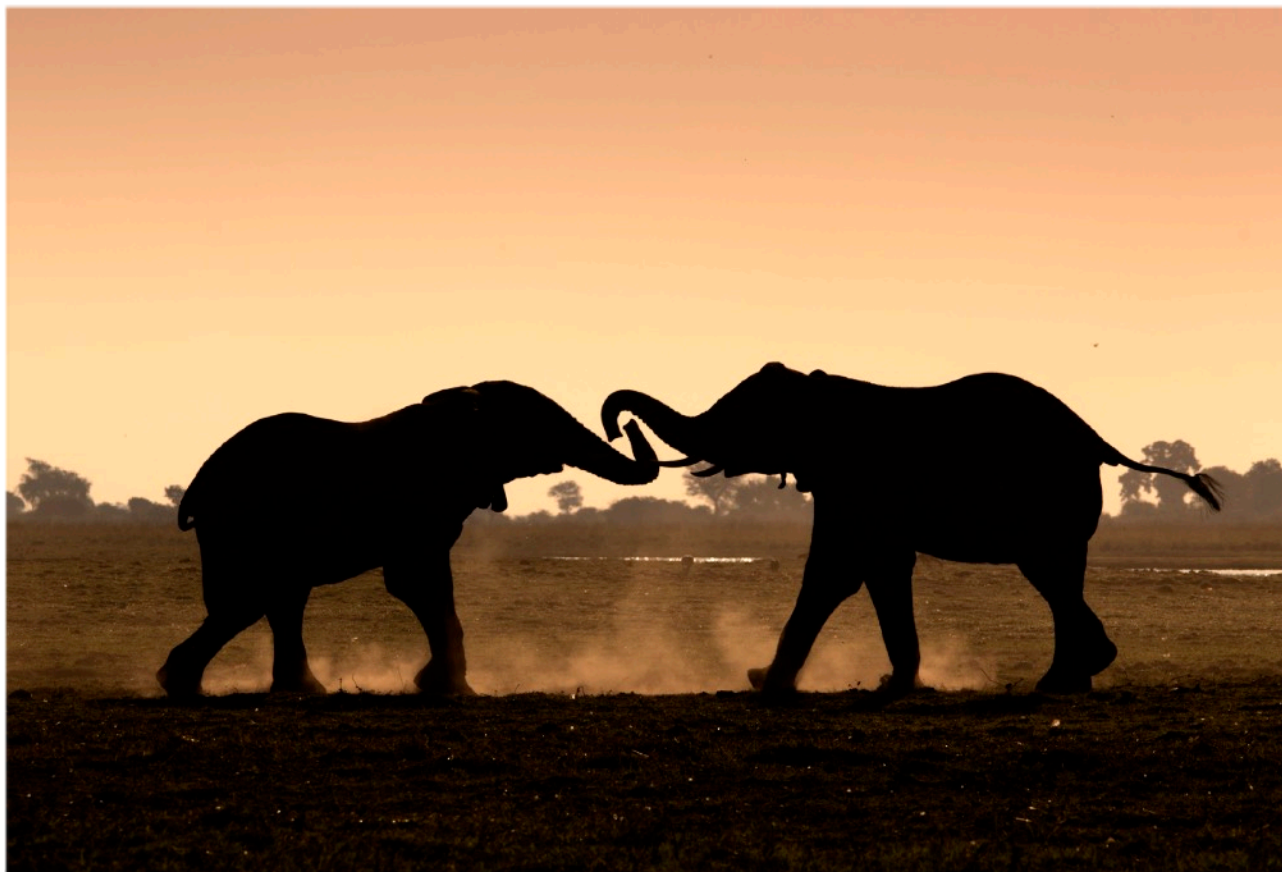
Elefanter i Chobe National Park

Boende: Kubu Lodge Måltider: Frukost - Lunch - Middag