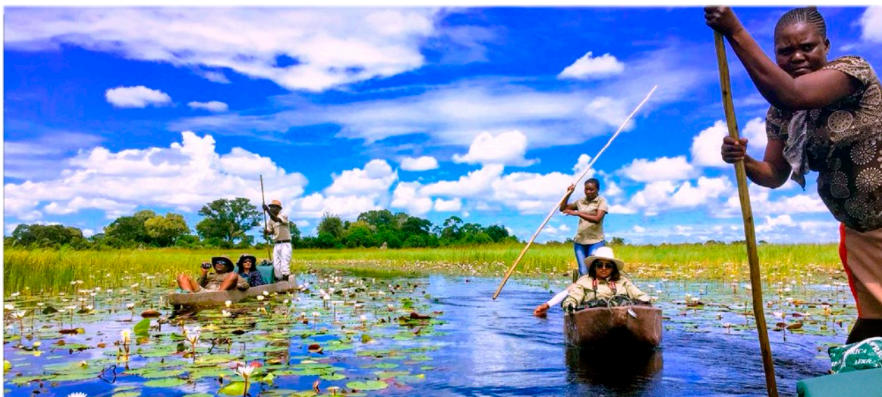
MOKORO SAFARI I OKAVANGODELTAT