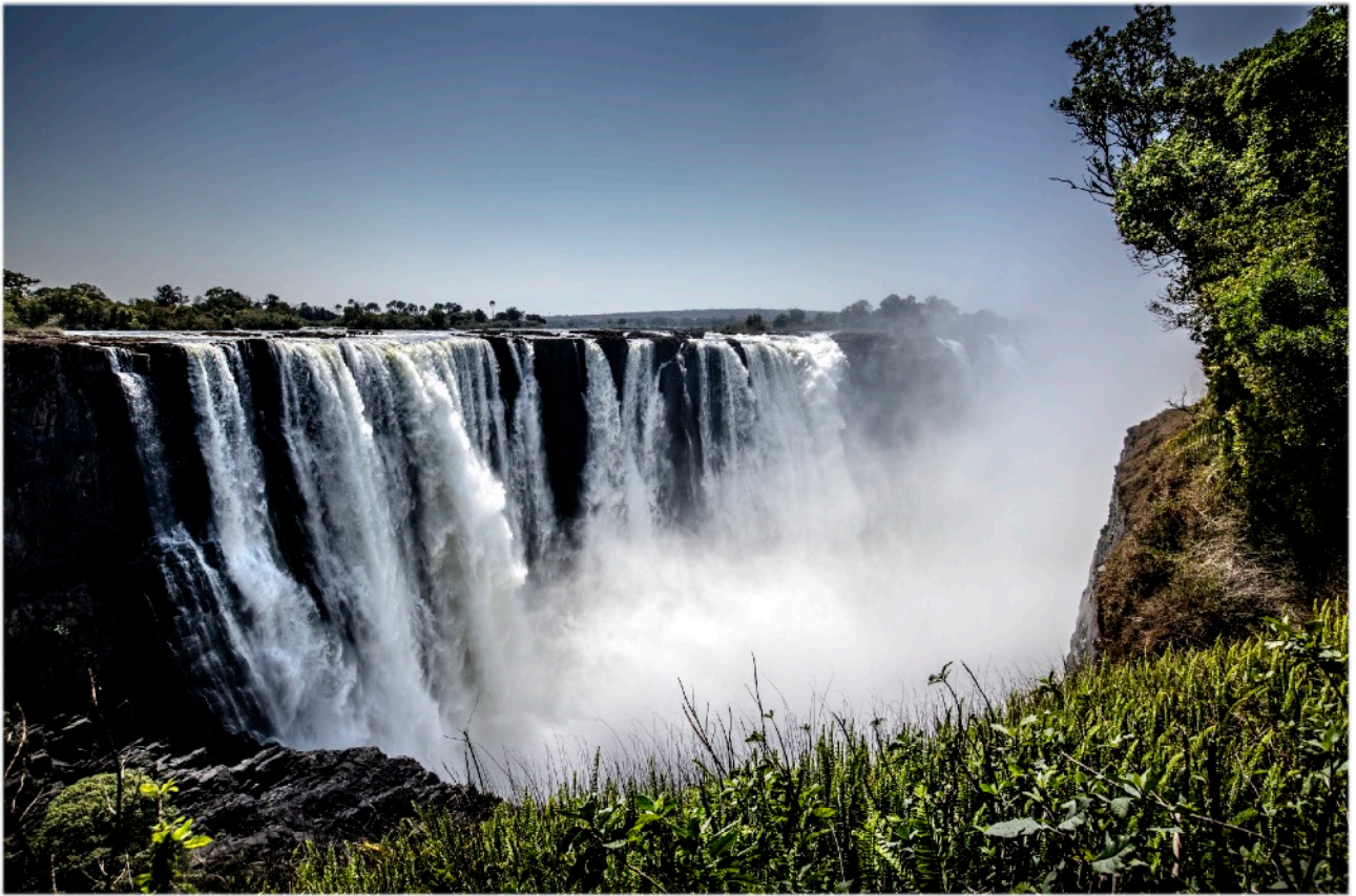
VICTORIA FALLEN, ZIMBABWE