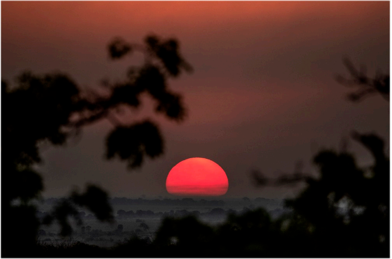
SOLNEDGÅNG ÖVER CHOBE NATIONAL PARK