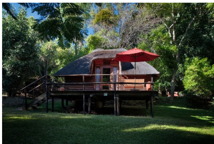
KUBU LODGE, KASANE