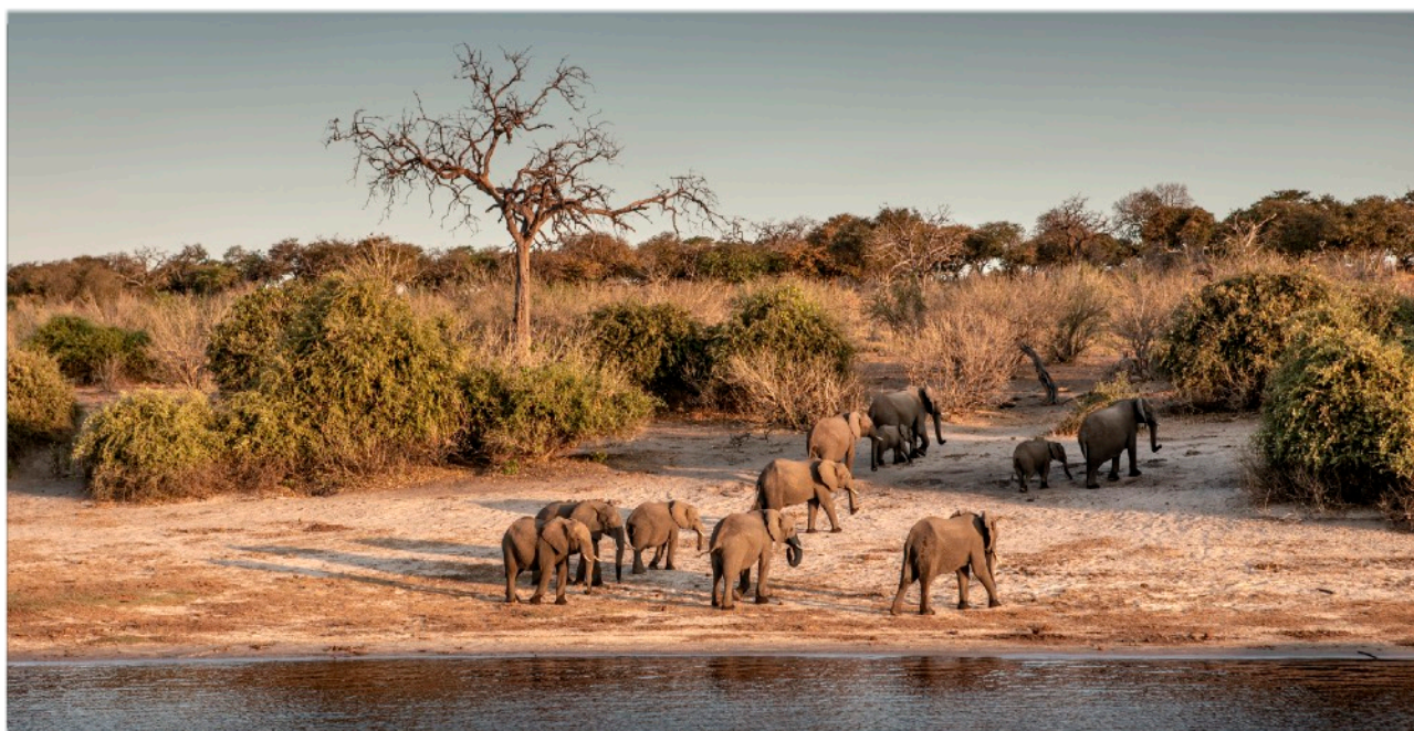
ELEFANTER VID CHOBE FLODEN