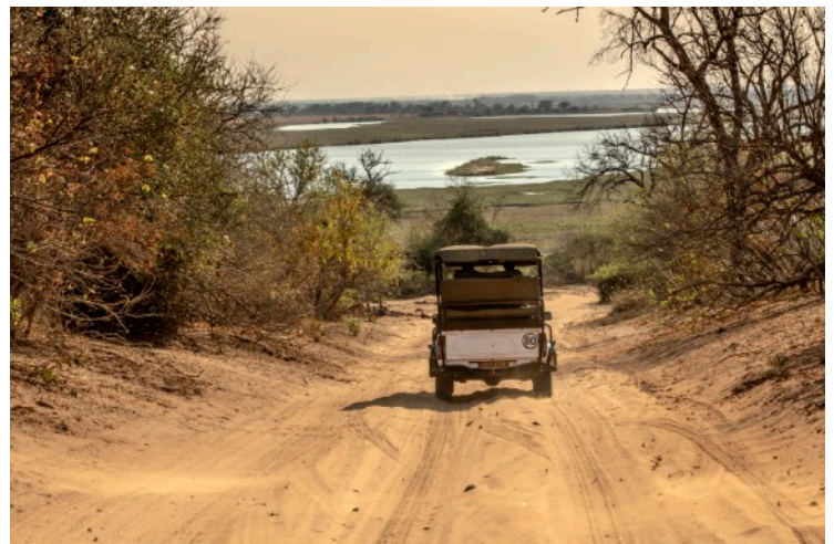
CHOBE NATIONAL PARK