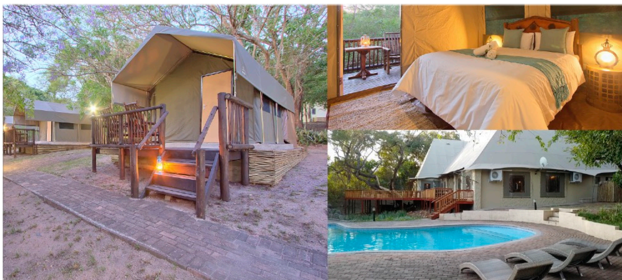
BOTETI TENTED SAFARI LODGE