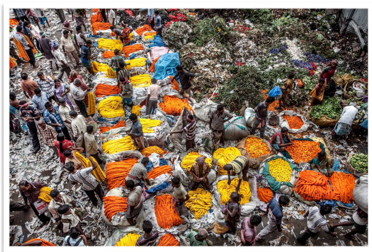
Malik Ghat blomstermarknad

Tidig uppstigning. Vi åker över världens mest trafikerade bro, Howrah bron, över till stadsdelen med samma namn. Vi besöker ett litet tempel och ett Ghat där vi ser solen gå upp från ett vackert och lummigt område vid Hooghly floden (Ganges heter så här) Vi promenerar tillbaka över bron. Vi besöker Malik Ghat blomstermarknad, som ligger vid det östra brofästet. Efter att ha tittat runt på denna färgsprakande marknad innan vi beger oss hemåt hotellet för frukost. Efter frukost väntar stadsdelen Kumatholi för att bese alla duktiga skulptörer som håller till här. Dags för en fika, Vid College Street och tar en kopp kaffe på India Coffee house som andas kolonialtid lång väg. Ett mysigt ställe med riktigt gott kaffe The Mother house, Moder Therasas grav och museum besöker vi sen och. Hinner vi gör vi även ett besök i Kali Ghat som är ett fascinerande tempel. Kvällens program bestäms på plats då det är Durga Puja festival. Gemensam middag på hotellet eller i dess närhet.