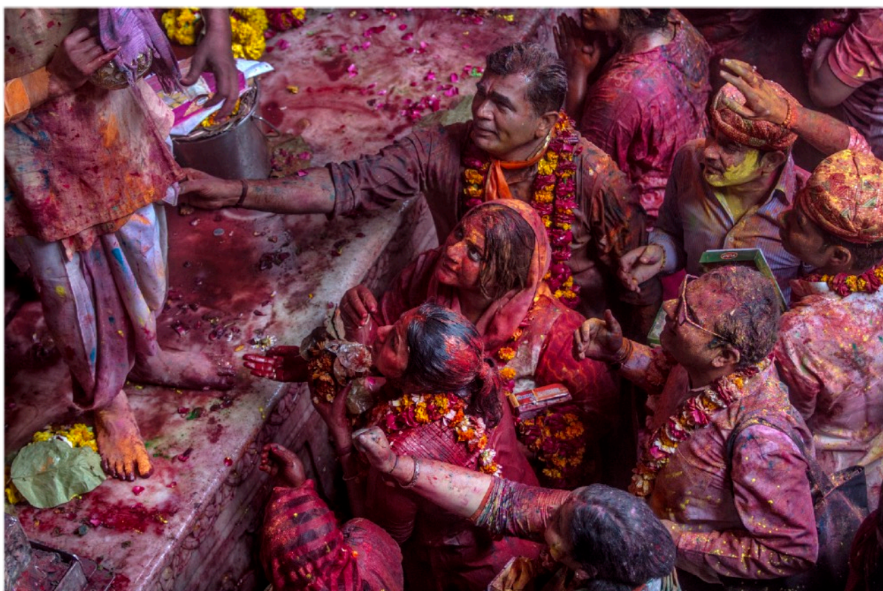
Holi i Bankey Bihari Templet

På morgonen besöker olika Lord Krishna tempel och även Bankey Bihari templet där Holi är i full gång. På kvällen är det Holika Dahan: - eller bränning av Holika. En slags valborgs eld. Det bålet brinner vid Holiporten. Promenerar längs de smala gränderna ner mot Yamuna floden och bevittnar bål överallt. Övernattning och gemensam middag på hotell i Vrindavan.