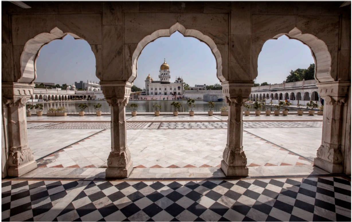
Gurudwara Bangla Sahib