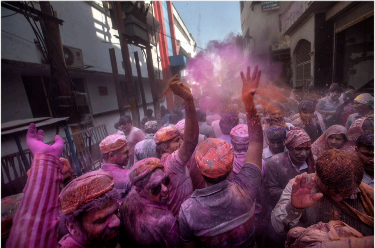
Holi i Vrindavan

Följ med på denna spännande resa till Indien är att deltaga i färgfestivalen Holi . Du kommer även få se det bästa av både Delhi och Agra, där Taj Mahal ligger